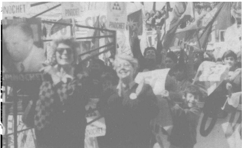
皮诺切特夫人露西娅领导的智利“母亲中心”成员们集会支持皮诺切特

生涯昭示世人。智利的有识之士认为，皮氏具有强烈的个性，对自己的一生经过周密的设计，既大奸大滑，又大智大勇。垂暮之年已力不从心，猛感到大势所趋，已到了还政于民、激流勇退的时候了。为了安全“软着陆”，他分三步走：先交政权——再交军权——当上终身参议员。1989年他在公民投票中以接近半数的得票抱憾败北，仍一言九鼎把政权移交给了艾尔文文人政府；10年后又信守诺言把军权移交给了新的陆军司令伊苏列塔中将。当皮氏当着弗雷总统的面老泪纵横地把权杖和佩剑交到接班人手中时，鸦雀无声的会场政要和将领突然报以雷鸣般掌声。这掌声宣告了这位铁腕将军65年戎马生涯的休止，同时也标志了“皮诺切特时代”在智利的结束。