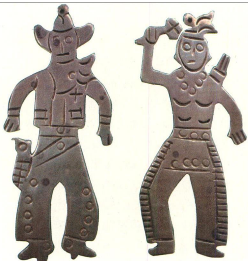
塔斯科的银器总是透着浓浓的印第安土著风情。

一件银器也没有相中,也没关系,他也会热情地跟你告别。这里你根本听不到叫卖声。当你选中了银器,他会热情地问你要几个包装袋,小心地帮你把银器包好,并在每个包装袋上贴上一个本店的纸条。一桩桩银器生意,就在这悄无声息中进行着。