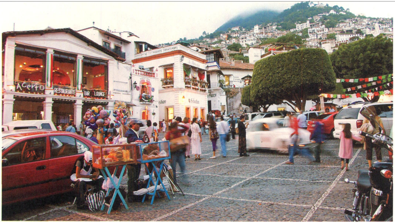
塔斯科是一座山城,这里的居民大多经营着前店后坊的银器生意。