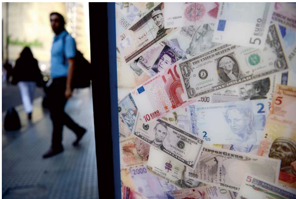
阿根廷新政府2015年12月16日宣布取消实行了近四年的外汇管制措施，开始实施自由浮动汇率。 图为2015年12月16日，在阿根廷首都布宜诺斯艾利斯，一名行人路过市中心的货币兑换处。

在马克里看来，“基什内尔主义”是深嵌于阿根廷社会的一颗“毒瘤”，必须予以根除。因此，他通过在经济和外交方面推行与前政府大相径庭的执政理念、在政治上清算前政府的腐败行为，试图消除“基什内尔主义”给这个国家留下的左翼印记。但是，作为庇隆主义的继承，“基什内尔主义”在阿根廷有着牢固的社会根基，其影