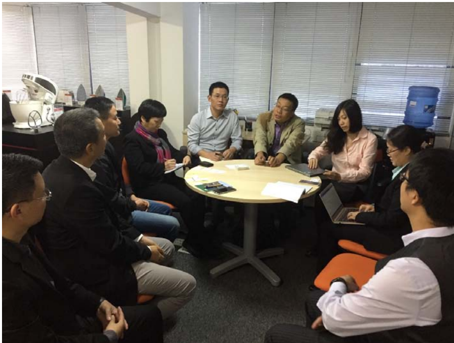
代表团与部分在巴中资企业负责人座谈

出席会议的中资企业负责人和代表分别介绍了各自所在中企在巴西投资和经营情况以及企业在解决劳工、环保、税收、本地化经营等方面的经验和教训。他们指出，目前中资企业在巴西遇到了许多问题，其中既普遍同时又比较突出的问题有劳工成本高、行业垄断性强、税务制度复杂、制度僵化以及海关和进出口管理机构腐败严重，等等。中企应对巴西国情有充分认识，强化自身的学习，尊重当地风俗习惯，积极融入巴西文化，针对特殊情况，逐一细致耐心地解决问题。