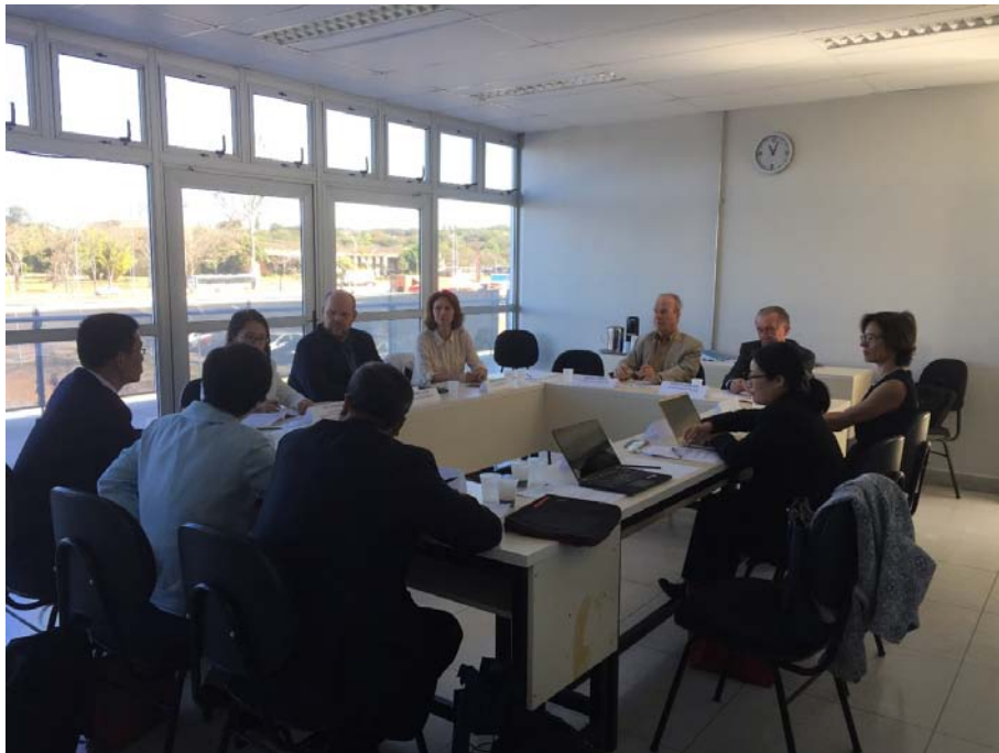
代表团与巴西利亚大学国际关系学院学者座谈

巴西学者指出，自20世纪30年以来，巴西对外政策就形成了全面、避免冲突、合作、和平等几大传统，在对外关系中不会歧视任何性质的政府。当前巴西的政治危机不会对外交政策产生影响，特梅尔政府上台后的对外政策基本延续了上述四个特点。