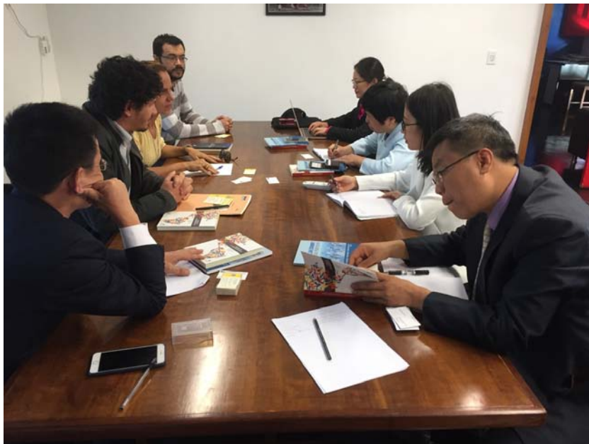
代表团成员与巴西利亚大学拉美研究系学者座谈

拉美研究系前身为美洲研究中心，隶属于巴西利亚大学社会科学学院。从地区和全球视角进行跨学科比较研究是其优势和特点。研究的学科涵盖政治学、经济学、社会学和民族学等等，研究议题包括拉美地区各国的地区组织、贩毒和公共安全、拉美左派、发展政策、移民、印第安人和对外关系等等。拉美研究系还开设硕士和博士课程，出版两本杂志，一本主要刊登拉美研究的文章，另一本则是与墨西哥研究机构合作出版的法律方面的杂志。