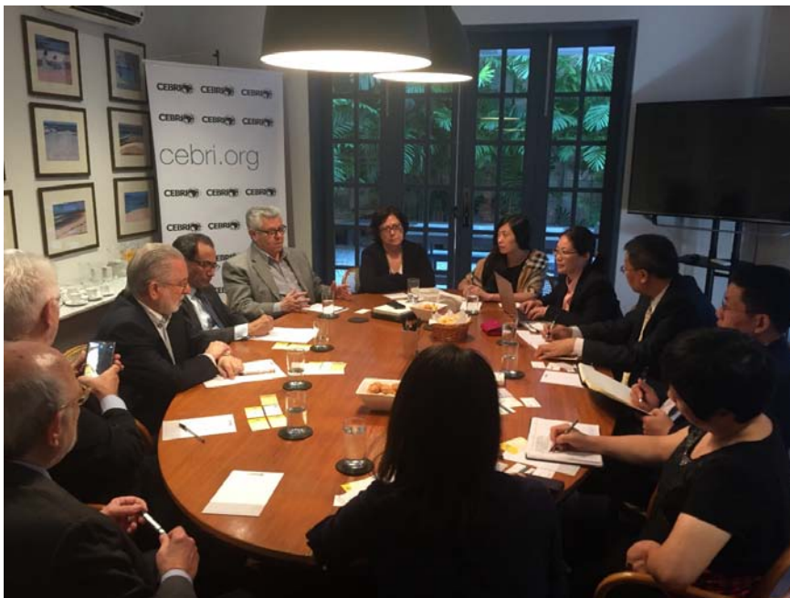
代表团与巴西国际关系研究中心和中巴企业家委员会学者座谈

巴西学者向中方学者提出了很多问题，涉及中美关系、中日关系、金砖政策、中巴经贸关系、中国与委内瑞拉关系等领域，中方学者均予以耐心解答。