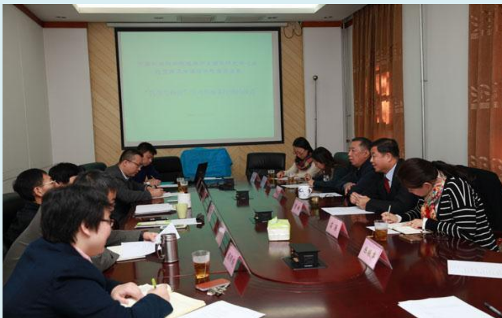
座谈会暨签约授牌仪式会场

2014 年 11 月 3 日，中国社科院拉美所墨西哥研究中心与北京第二外国语学院西葡语系“教学科研实习基地”签约授牌仪式暨“中墨教学与科研座谈会”在我所举行。